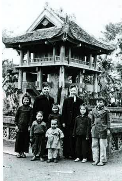
SOUVENIR Devant la pagode au Pilier unique, une famille de Hanoïens d'antan.